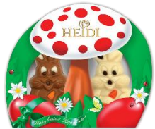
Osterhasen Paar mit Pralinenfüllung 2x 20g = 40g € 1,30