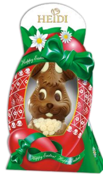
Osterhase mit Blumen 100g € 2,50