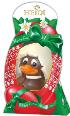
Ente im Ei 75g € 1,90