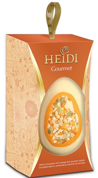
ORANGE KÜRBISKERN 130 g € 4,50