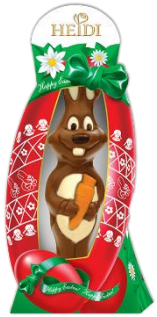
Osterhase mit Karotte 45g € 1,30