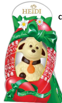
Pascal das Lamm 75g € 1,90