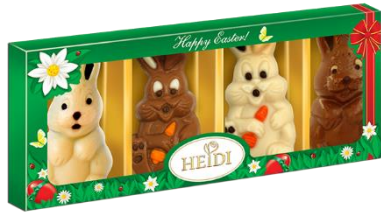
Osterhasen Set mit Pralinenfüllung 4x 20g = 80g € 2,50