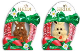
Osterhase mit Pralinenfüllung 20g € 0,70