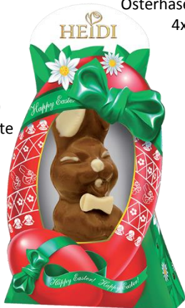
Hase mit Mascherl 75g € 1,90