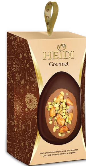
MANDEL PISTAZIE 130 g € 4,50