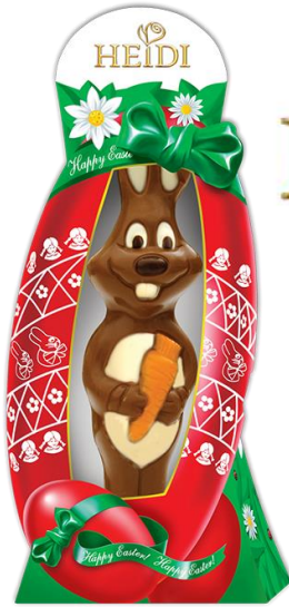
Osterhase mit Karotte 160g € 3,90