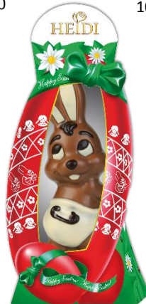
Baby Hase 100g € 2,50